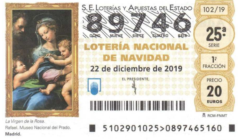
La Virgen de la Rosa. Rafael. Museo Nacional del Prado. Madrid.